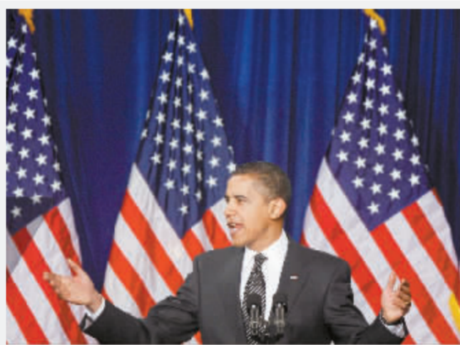
18 日奥巴马公布住房救援计划

从现状来看,美国的楼市危机并未出现明显改观迹象,反而有继续恶化的趋势。美国商务部 18 日公布的数据显示,美国 1 月份新房开工量跌至历史最低点,比前一个月下降了 16.8%,经季节调整按年率计算仅为 46.6 万套,较去年同期减少 56.2%。